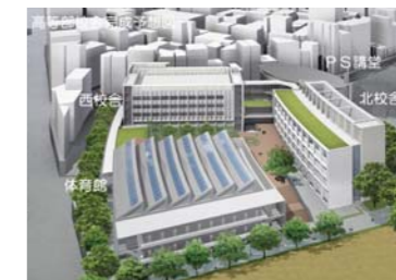
高等部校舎完成予想図

「青山キャンパス再開発」の一環により、高等部でも2008年8月から校舎の建て替えに着手しています。工事は3期に分かれて実施されますが、2010年3月に西校舎が完成し、4月から新校舎での学びがスタートしました。今後、北校舎とPS講堂が2012年3月、体育館が2014年12月に完成する予定です。