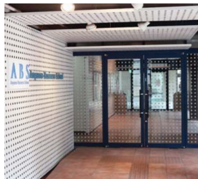
国際マネジメント研究科(青山キャンパス大学5号館)