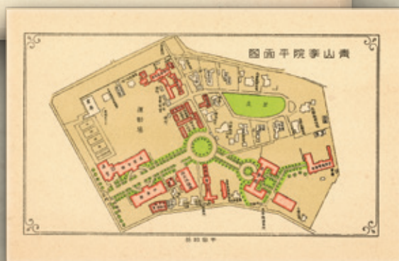
1928年頃の「青山学院平面図」。 高等女学部校舎(図面中央やや右下)は上から見ると「HAPPY」の「H」の字形を模していたという。

その後、1950年から新制高等部校舎として使用され、現在の高等部新校舎が完成するまで「北校舎」として使用された。その高等部は今年(2020年)、創立70周年を迎えた。