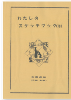
写真②「わたしのスケッチブック」(19)