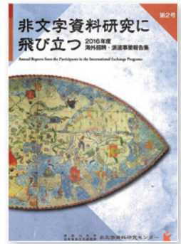
写真④「非文字資料研究に飛び立つ -2016年度海外招聘・派遣事業報告書-」