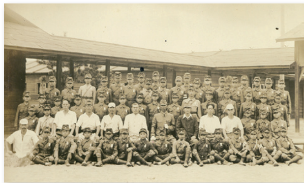
1943年(昭和18年) 中学部1年生の野営訓練(習志野演習場)

昭和20年5月の空襲で渋谷一帯は焼け野原になりました。学院の西側は焼けて土台だけの残っ