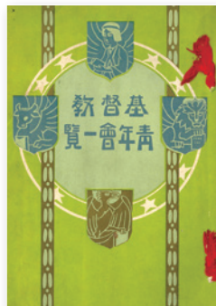
写真⑥「基督教青年会一覽」