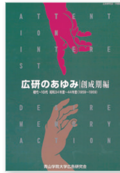
写真③「広研のあゆみ 創成期編 初代～10代 昭和34年度～44年度 (1959～1969)」