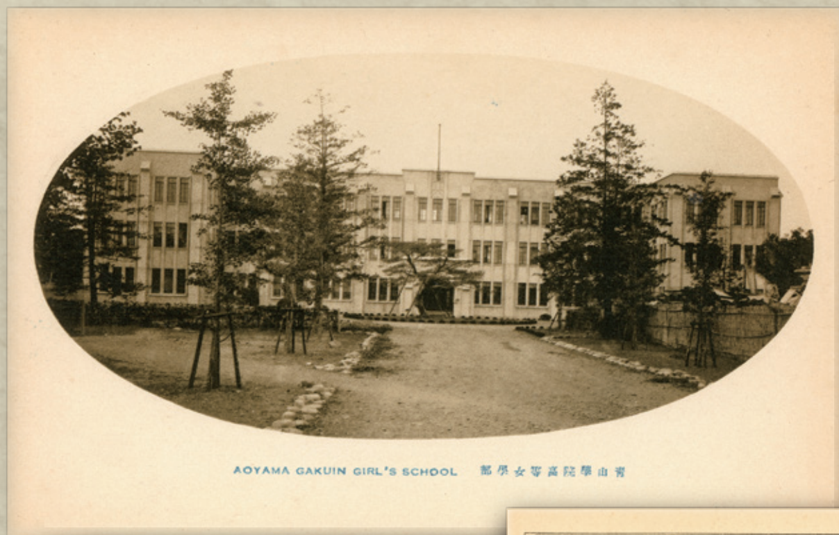
AOYAMA GAKUIN GIRL'S SCHOOL 高等女学院青山