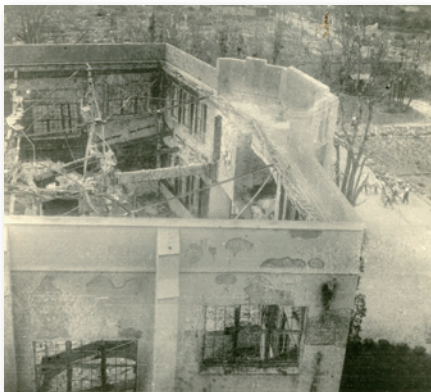
1945年(昭和20年)8月 プラット記念講堂 聖歌隊に両高

当時は現在のような男女共学の高等部ではなく、男子部・女子部と分かれていました。戦前