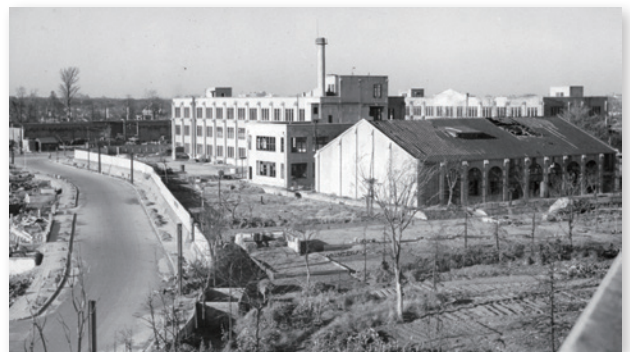
1945年(昭和20年)11月11日撮影 女子部屋上より見たる中学部校舎と講堂

私達世代に最も大きな影響をもたらしたのは、戦後の教育制度改革です。これまで女学部を5年で卒業していたのが、現行の6.3.3制となり、私達は女学部5年で卒業するか、新制の女子高等部3年に進学するかの決断をせまられました。また同時に、新しく大学制度が設けられ、新制高等学校を卒業すれば、女子にも大学受験の資格が与えられ大学進学が可能になりました。当時の社会状況の中で、学年の三分の一弱の方が、就職の道を選ばれました。また、中国・満州な