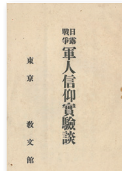
写真⑦「日露戦争軍人信仰實驗談」