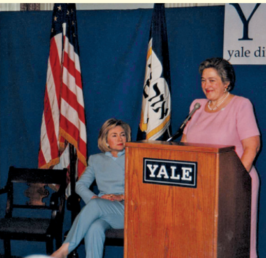
ヒラリー・クリントン氏（左側） ※執筆者が留学中の1998年、Yale Divinity Schoolに講演にいらした時の写真。ブルーのスーツに身を包んで座っているのがヒラリー氏で、司会者によって講師の紹介がされているところ。執筆者本人が撮影。

自分たちの国のリーダーとなる人が、どのような思想や信仰を持ち、どのような舵取りをしようと考