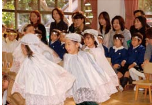
幼稚園 イエスさまご降誕の劇 (2007年度 クリスマス礼拝)