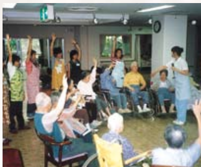
救世軍恵泉ホーム(特別養護老人ホーム)訪問