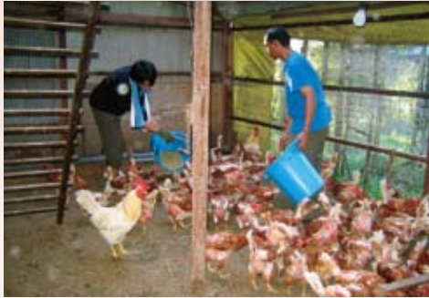
グリーンキャンプ