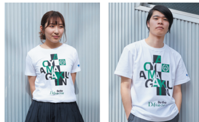
(モデル身長153cm レディースMサイズ着用) (モデル身長170cm メンズLサイズ着用)